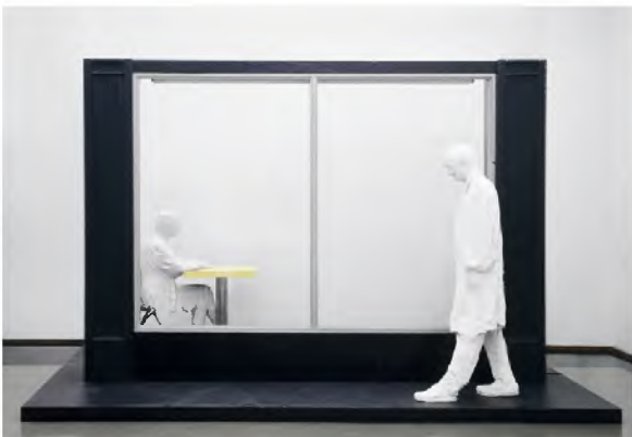
George SEGAL, Restaurant Window , 1967, Gips, Holz, Metall, Plexiglas, Neonröhren