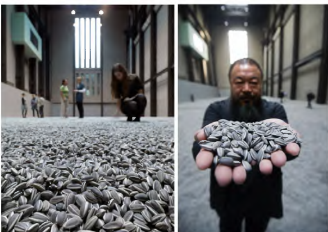
Ai WEIWEI, Sunflower Seeds , 2010, Porzellan, Installationsansicht Tate Modern London