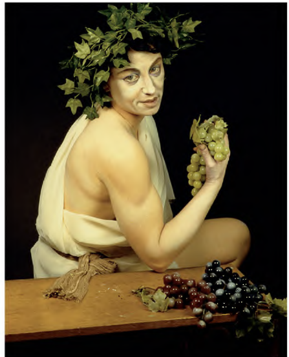
Cindy SHERMAN, Untitled #224 , 1990, History Portraits

Untermauern Sie ihre Analyse anhand von Beispielen aus dem Schaffen der Künstlerin.